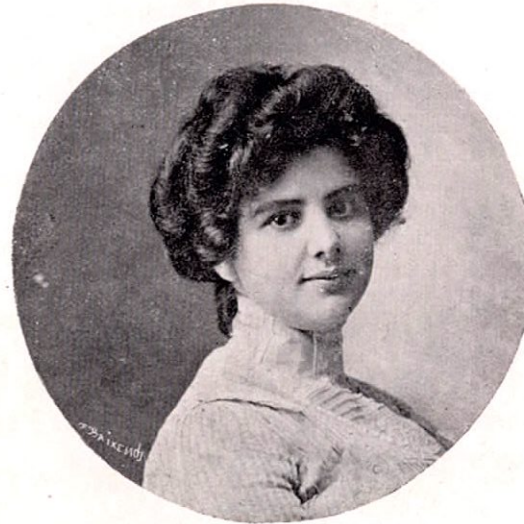
Fot. Paynter Bros.

Se oyen gritos de pavora cual de alegre caravana, gritos que dicen: ¡a un lado! ¡no se metan! ¡que los mata con las ruedas mi carreta!... que camina cual con alas ó cual si el diablo llevase con sus cuernos y sus patas... Y las viejas se santiguan entornando las ventanas, y los conchos admirados, abren la boca, y la baba se les rueda en la camisa, sin saber de qué se trata. Los chiquillos, los charchuelas, los tútiles con su caja, lanzan gritos de contento al ver que rápida pasa la carreta, que sin bueyes, tanto bullicio levanta. Los dependientes de tienda abandonan la zaraza que á la linda compradora, le midieran con la vara. Los escribientes, los sastres, los zapateros, los criadas, todos vuelven á porfía estupefactos la cara. Y una vieja cejijunta, que á más cejona, ñata, que se las echa de lista, al punto furiosa exclama: ¿me quieren coger de suave? Lo que es yo no me engañan! Los caballos van adentro, y lo que comen son brasas! Don Jelipe bien lo sabe, que según cuentan is quianda , ensayando esa carreta, por ver si mete la pata, ó la moda que es lo mismo; unos dicen que se llama autómovil ó bisiauto, y que corre como una alma que en las uñas lleva el diablo... La vieja entonces se calla y contempla con asombro